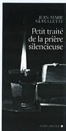
J.-M. Gueulette Petit traité de la prière silencieuse Albin Michel 187 pages, 12 €